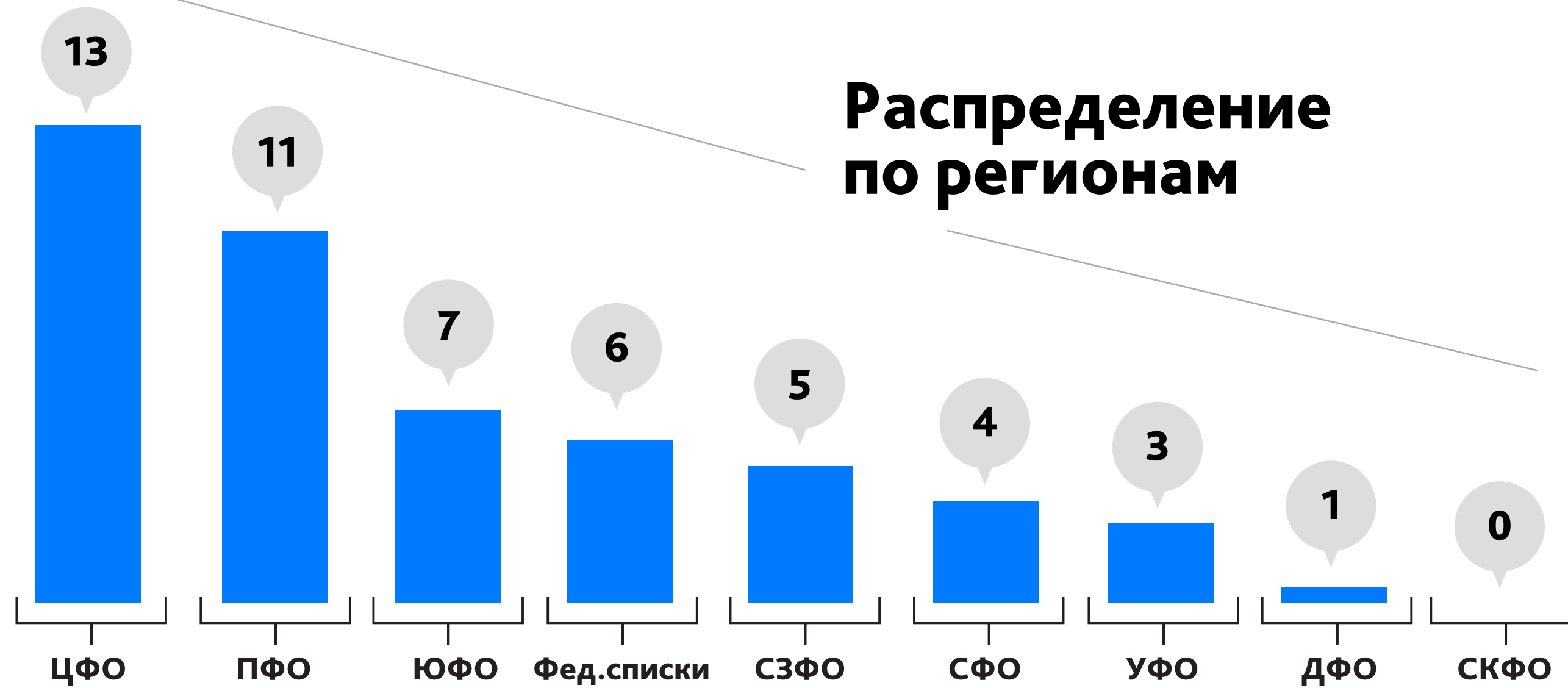
Распределение по регионам