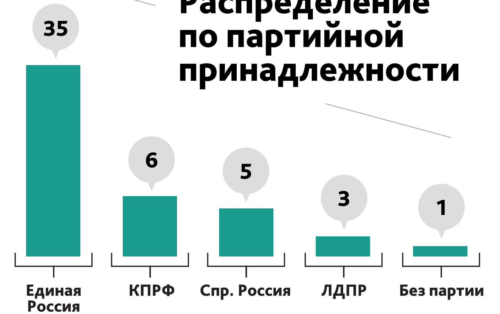
Распределение по партийной принадлежности